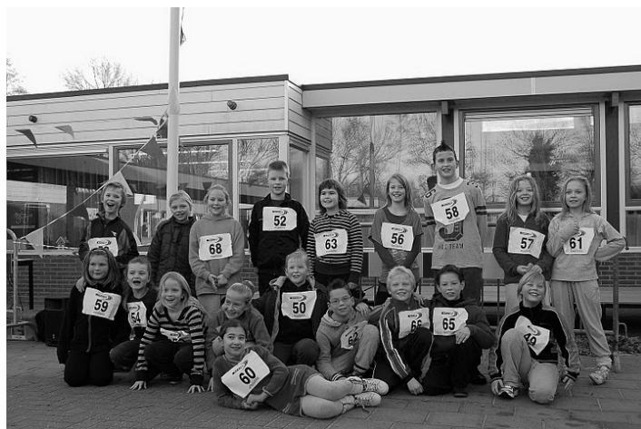
De sponsorlopers van groep 5