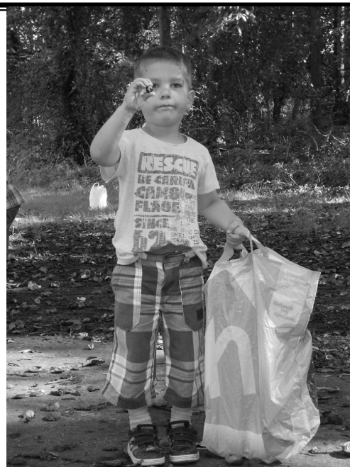
gr. 1/2 zoekt kastanjes in het bos